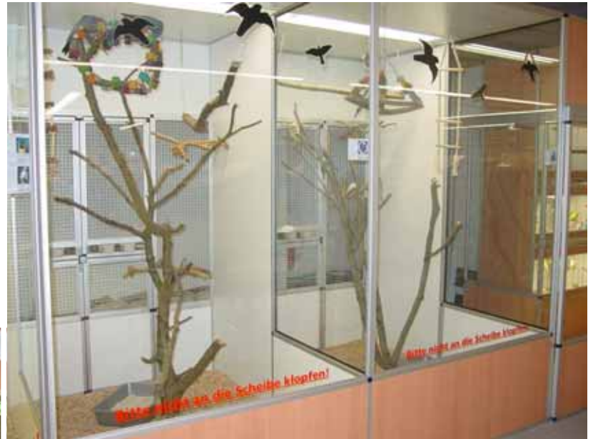
Abb. Dekor Buche