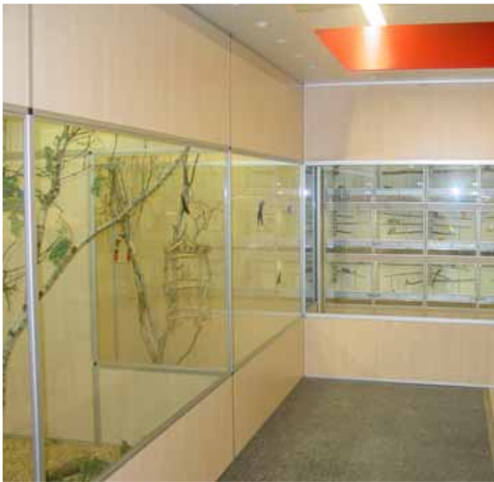
Abb. Dekor Ahorn