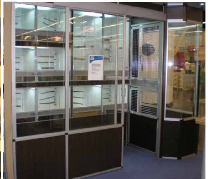
Abb. Dekor Maron / Silber