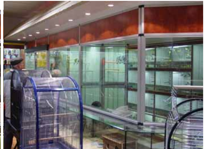
Abb. Dekor Wuzelholz dunkel