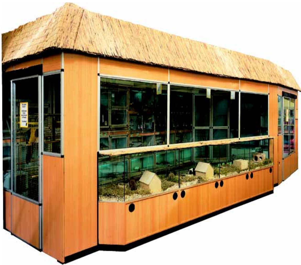
Abb. Dekor Buche