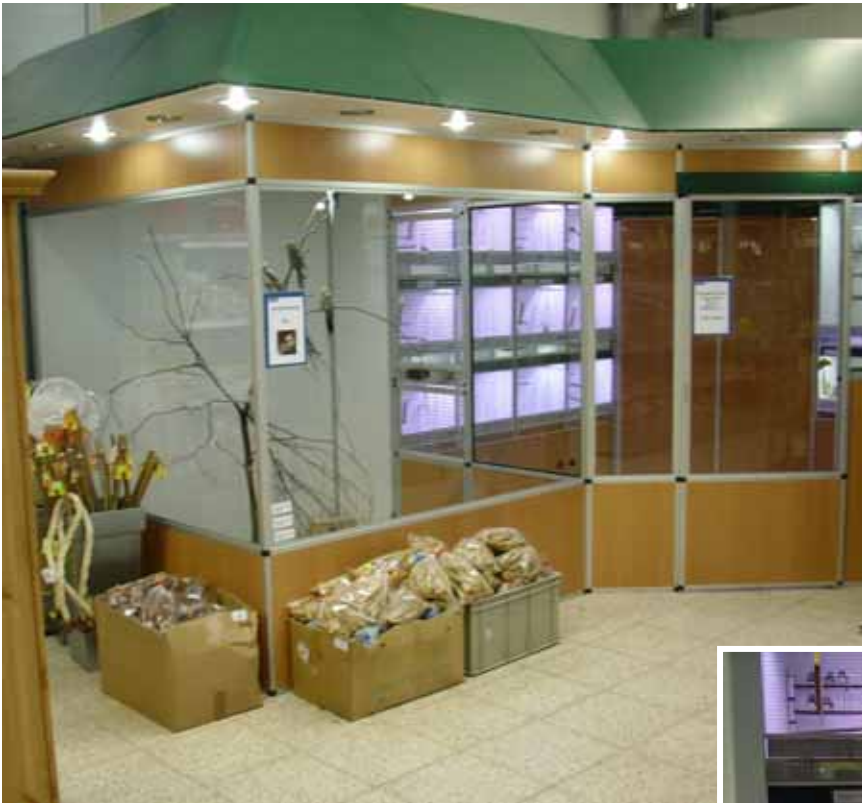
Abb. Dekor Buche