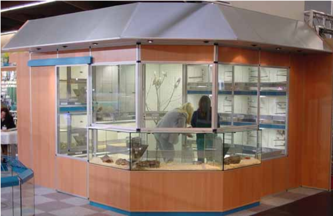
Abb. Dekor Buche