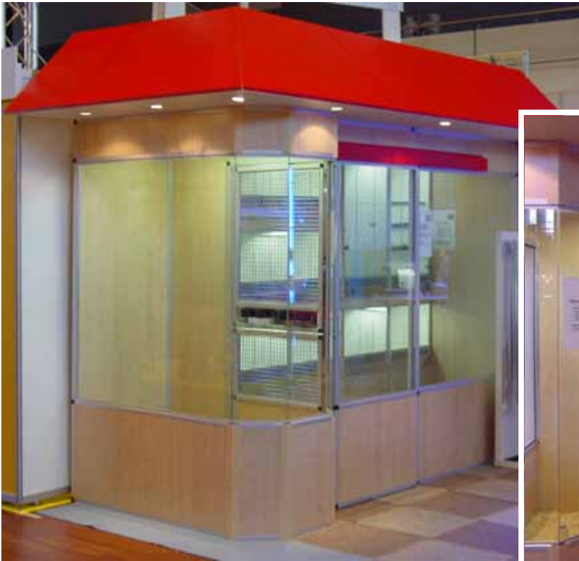
Abb. Dekor Buche / rot