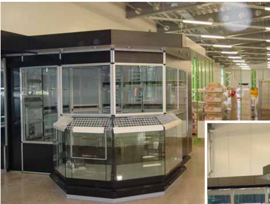
Abb. Dekor Esche schwarz