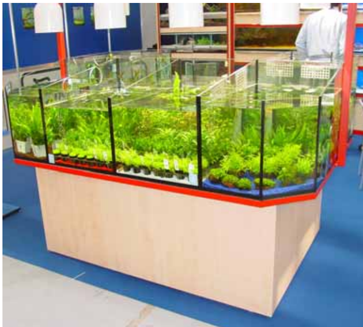
Abb. Dekor Ahorn / rot

Mit Luftsprudelsäulen und halogenbeleuchtendem Himmel