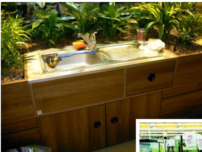
Abb. Dekor Nussbaum