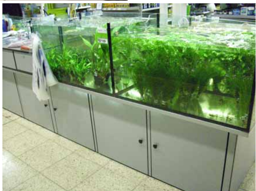
Abb. Dekor Silber RAL 9006 (weißaluminium)