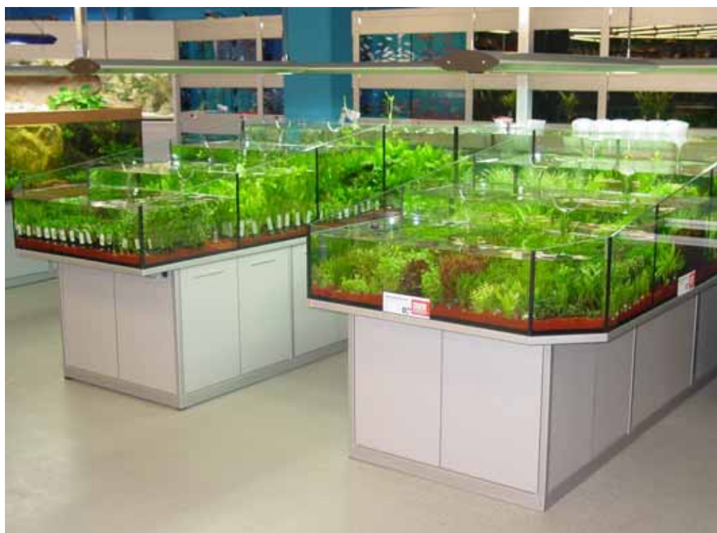
Abb. Dekor Silber RAL 9006 (weißaluminium)