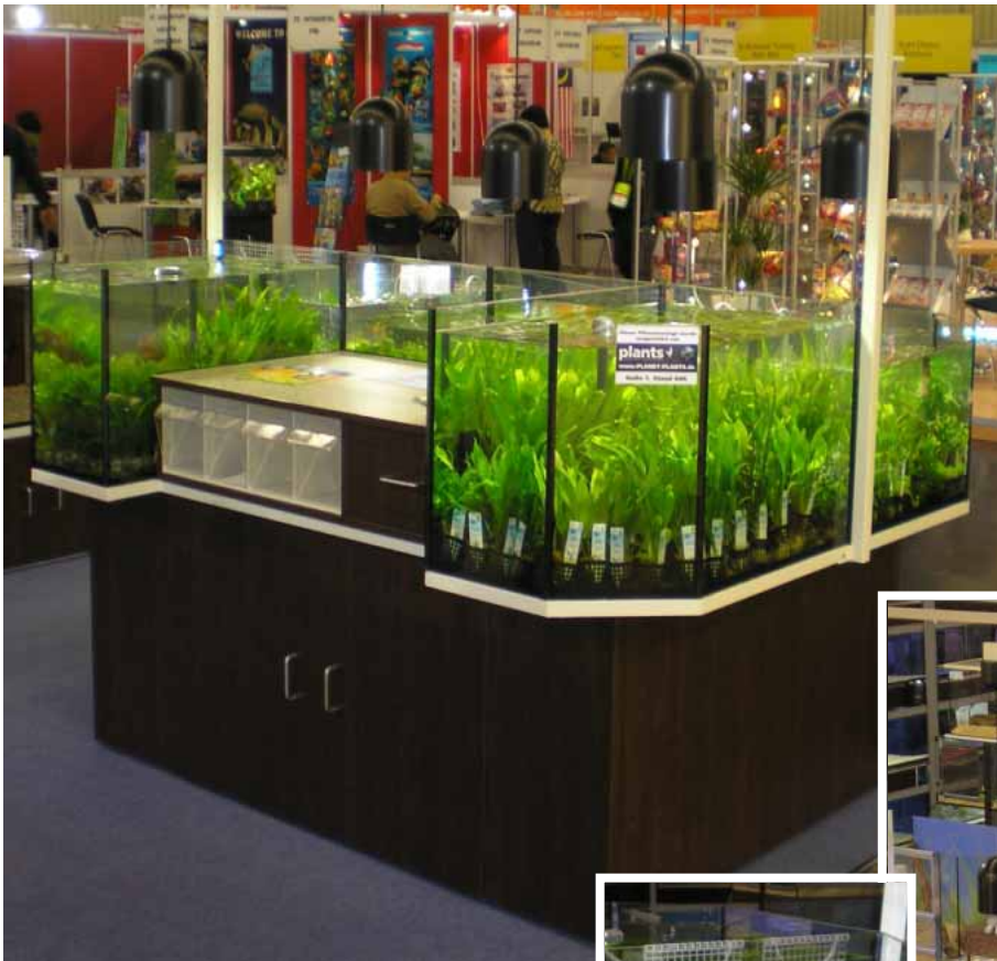
Abb. Dekor Maron