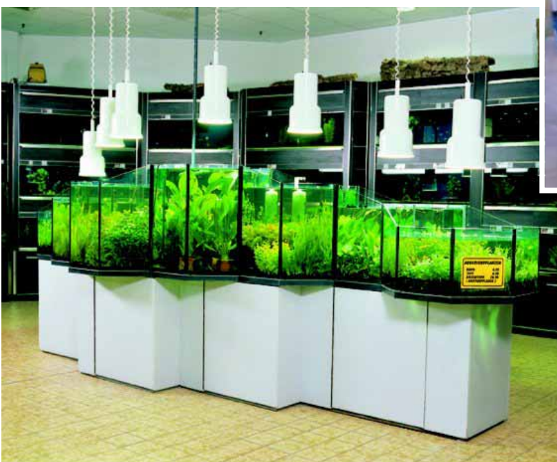
Abb. Dekor Rauchgrau