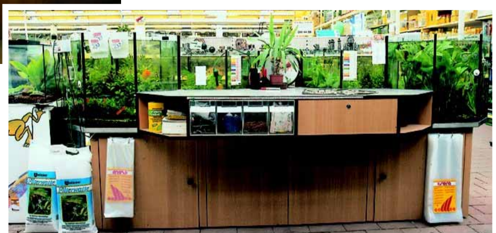
Abb. Dekor Buche