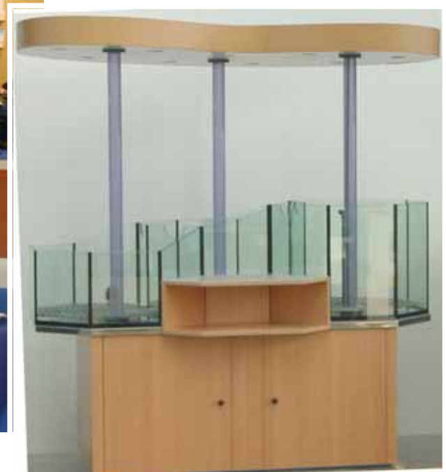
Abb. Dekor Buche