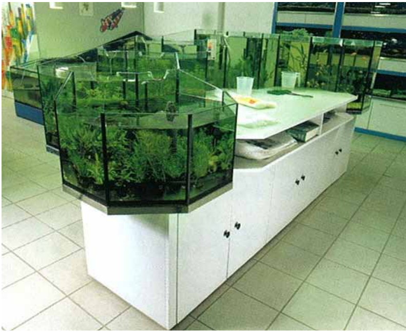
Abb. Dekor Uni weiß