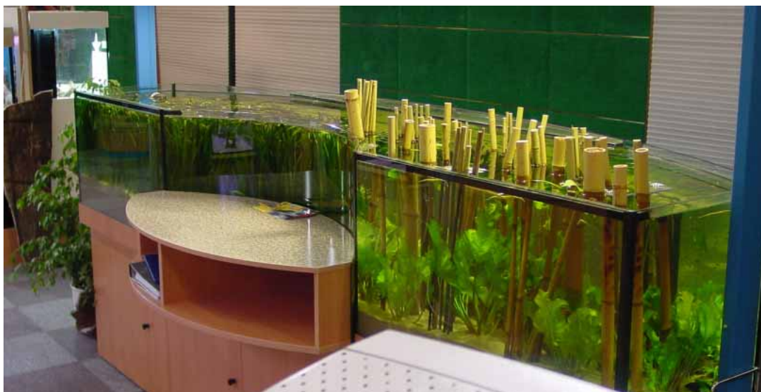
Abb. Dekor Buche