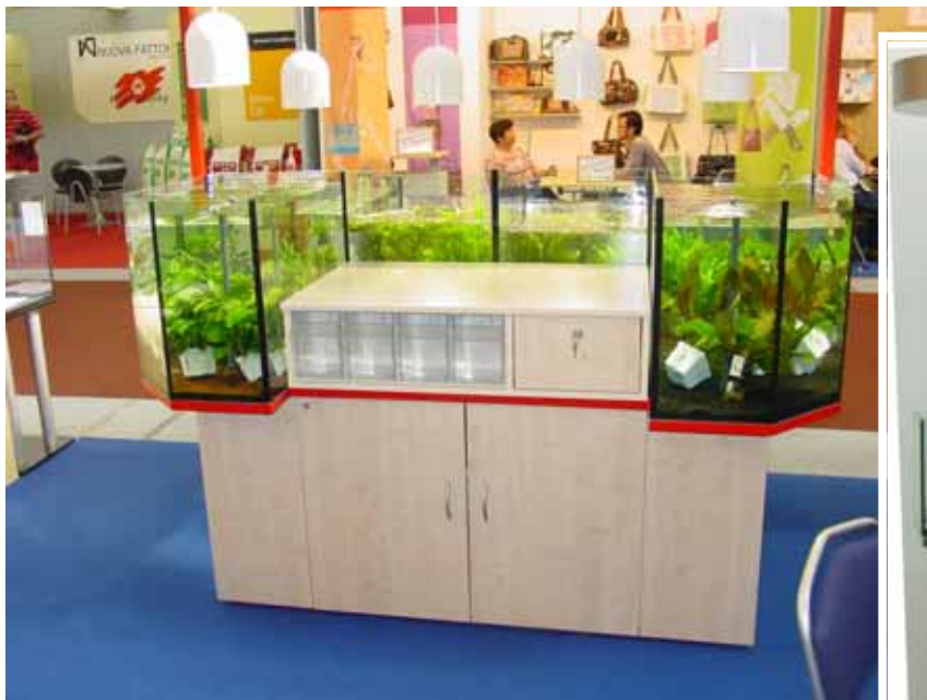
Abb. Dekor Ahorn / rot