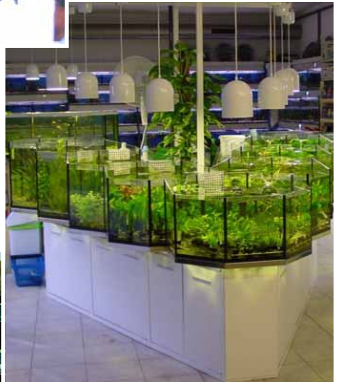
Abb. Dekor Silber – RAL 9006 (weißaluminium)