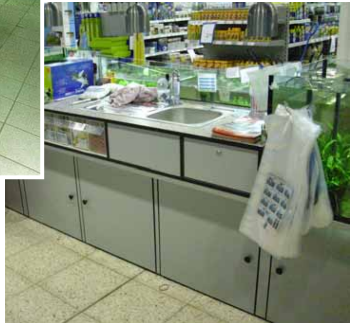
Abb. Dekor Silber / RAL 9006 (weißaluminium), Oberfläche Packtisch in Sardo Granit