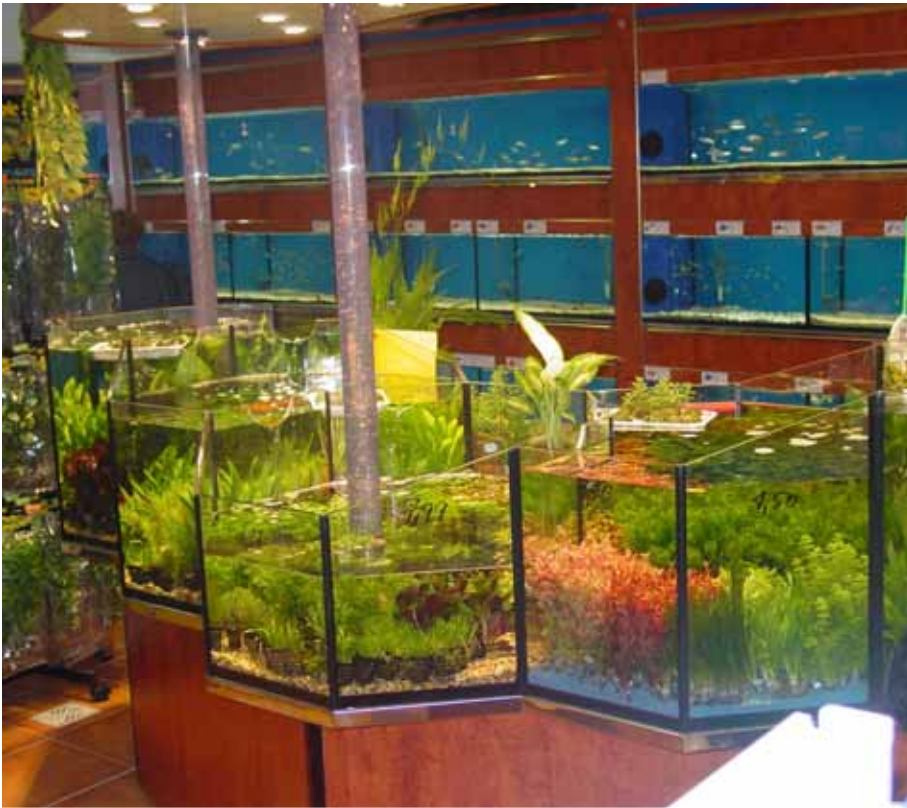
Abb. Dekor Wurzelholz dunkel mit Luftsprudelsäulen